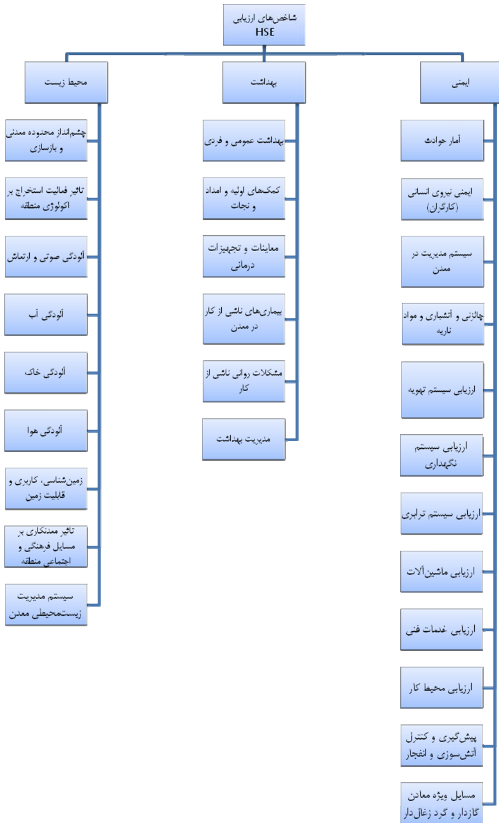
شکل ۱-۱- شاخص‌های ارزیابی HSE